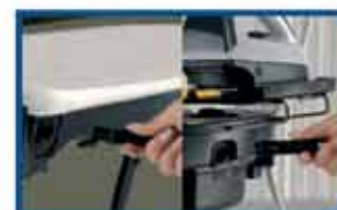
Avtagbar strømledning og dampjernkontakt.