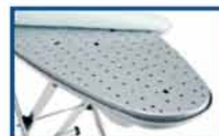
Oppvarmet strykebrett i aluminium med vakuums- og blåsesystem.