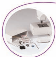
Masse gratis tilbehør medfølger.