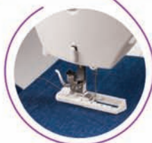
4-steps automatisk knapphull