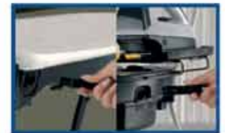
Irrotettava virtajohto ja höyryraudan pistoke