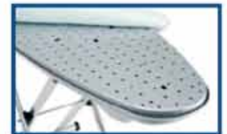
Alumiininen lämmitettävä lauta, jossa imu- ja puhallusjärjestelmä