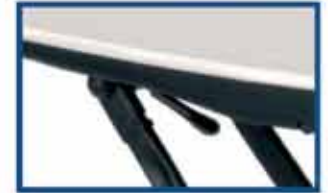
7 säätöasentoa lukitusjousen avulla