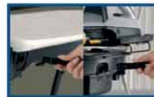
Aftagelig ledning og indbygget stik til strygejern